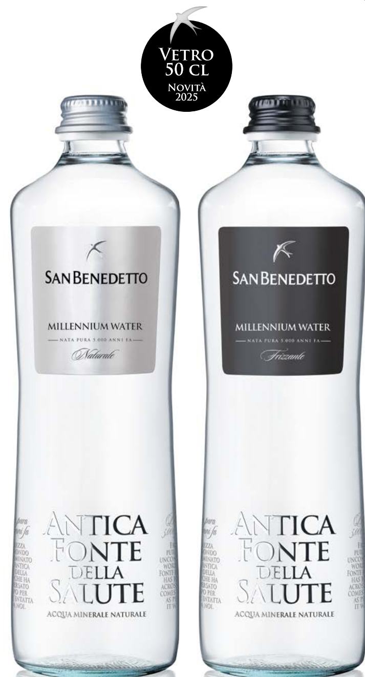
VETRO - 50 CL VAP/VAR