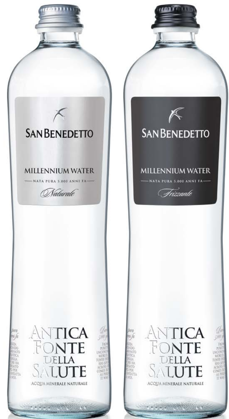
VETRO - 65 CL VAP/VAR