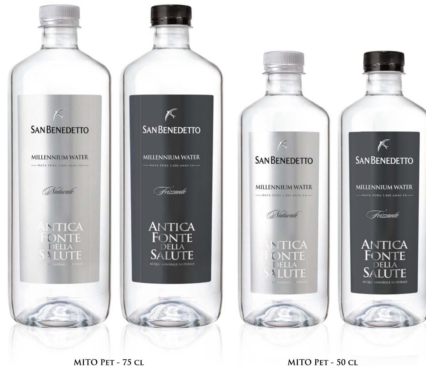
MITO PET - 75 CL

Un incontro perfetto tra stile e praticità, porta Millennium Water anche sulle tavole esclusive delle località più inedite. Due nuovi formati in PET da 0,5 e 0,75 litri si aggiungono alla già nutrita gamma che spazia dal vetro alle lattine. Il design riveste l'originalità delle forme per dar vita a nuove bottiglie che coniugano la leggerezza e praticità del PET con l'eleganza ricercata che da sempre contraddistingue tutta la linea.