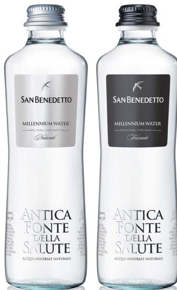
VETRO - 33 CL VAP/VAR