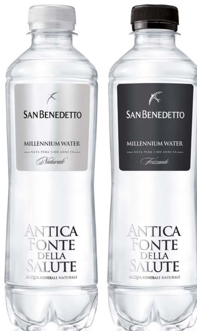
PET - 40 CL