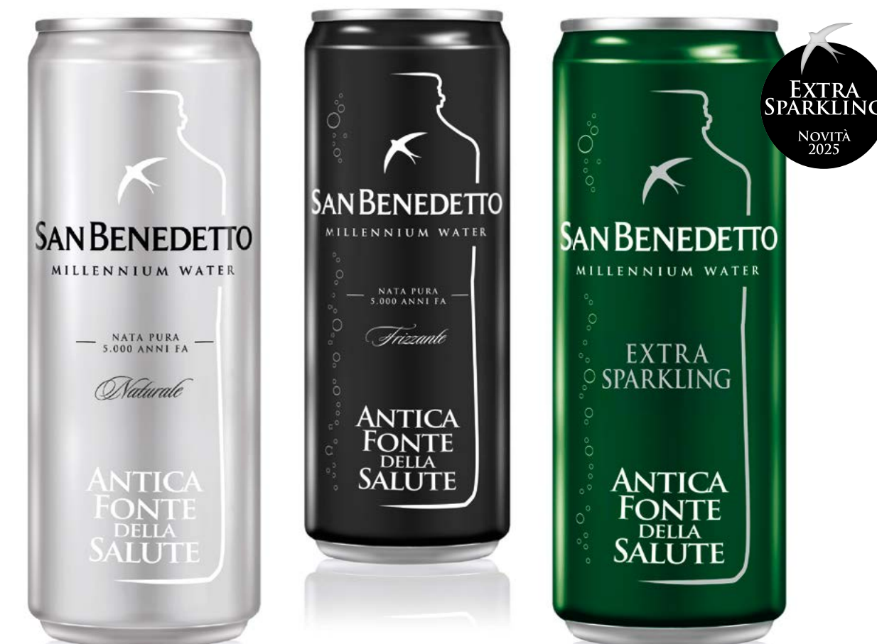
LATTINA - 33 CL SLEEK