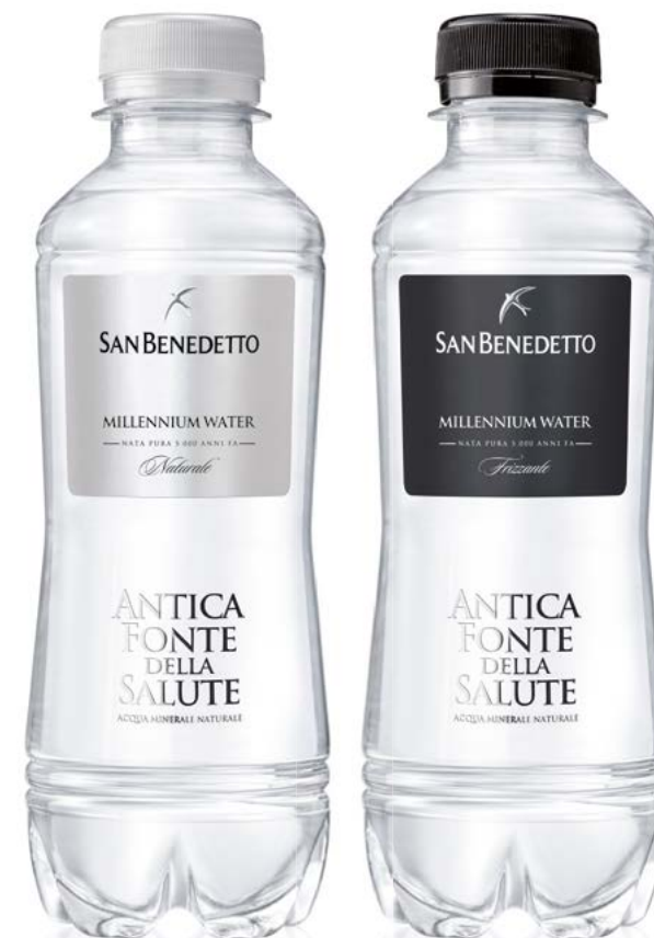
PET - 25 CL